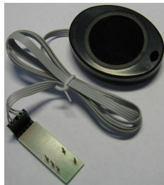
Рисунок 1. Цифровой индикатор температуры.

Индикатор температуры представляет собой микропроцессорное устройство, которое подключается к информационной шине CAN в автомобиле. Индикатор периодически посылает в шину диагностический запрос температуры ОЖ и количества сохраненных кодов ошибок. Электронные блоки управления двигателем, трансмиссией и другие, выдают на этот запрос соответствующие данные. Микропроцессор их принимает и после обработки отображает на светодиодном семисегментном индикаторе.