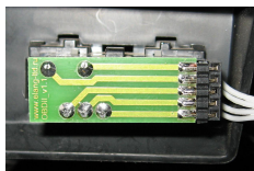
Рисунок 3. Разъем индикатора подключенный к диагностическому разъему.