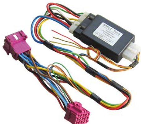
Рисунок 1. Модуль МАКС-2 Vesta

4.1 Модуль (рисунок 1) представляет собой электронное устройство, состоящее из управляющего микроконтроллера и силовых цепей коммутации нагрузки. Микроконтроллер по сигналу от охранной сигнализации или при нажатии кнопок управления стеклоподъемниками включает и выключает электродвигатели стеклоподъемников по заданному алгоритму.